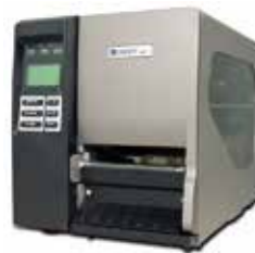
BBP®16ラベルプリンター 熱転写式/解像度: 600dpi