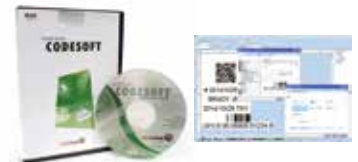
CODESOFT® バーコードデザインソフトウェア